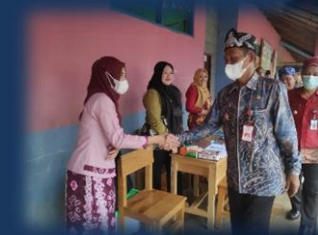
Pelayanan Keliling Perizinan Berusaha